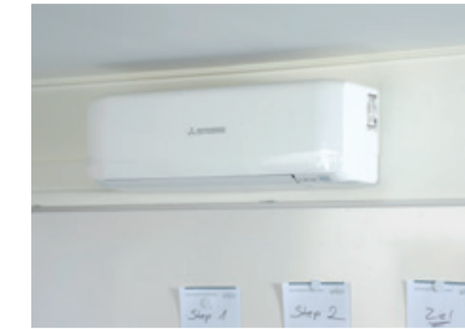
Das Innengerät mit natürlichem Kondensablauf