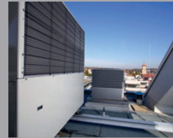
Gasmotorwärmepumpe auf dem Dach

Im Zuge der Modernisierung des Turmes der Kreissparkasse Waiblingen wurde auch bei der neuen Heizungs- und Kühltechnik auf Nachhaltigkeit und Energieeffizienz gesetzt.