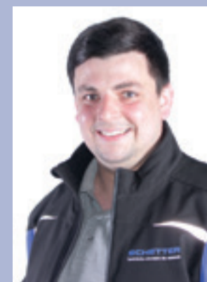
Dominic Hägele Facility Management Service