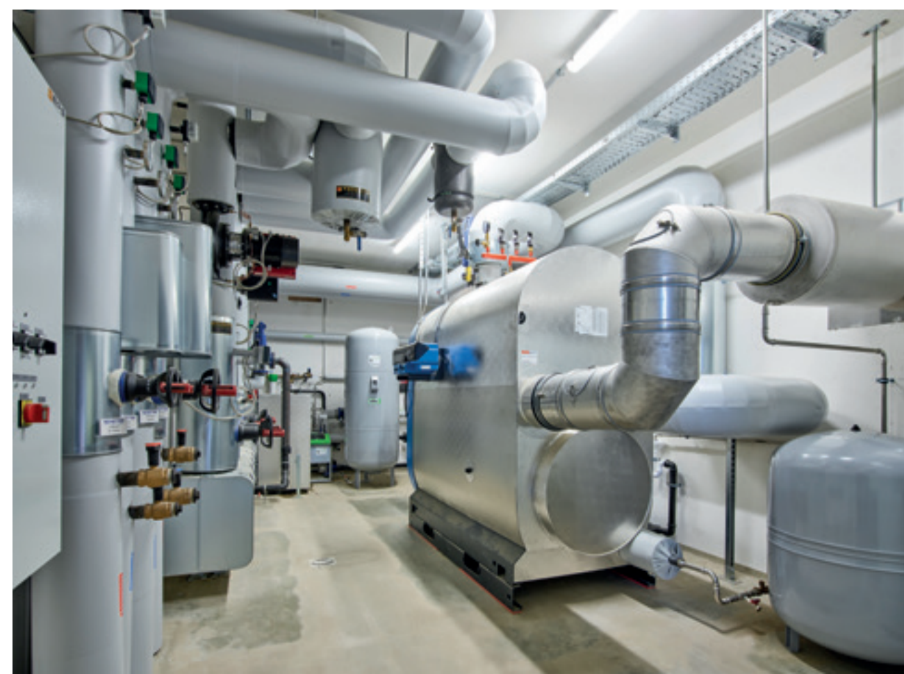
Der neu gebaute Heizraum