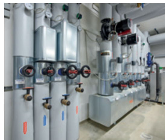
Verteilerabgang der Rasenheizung