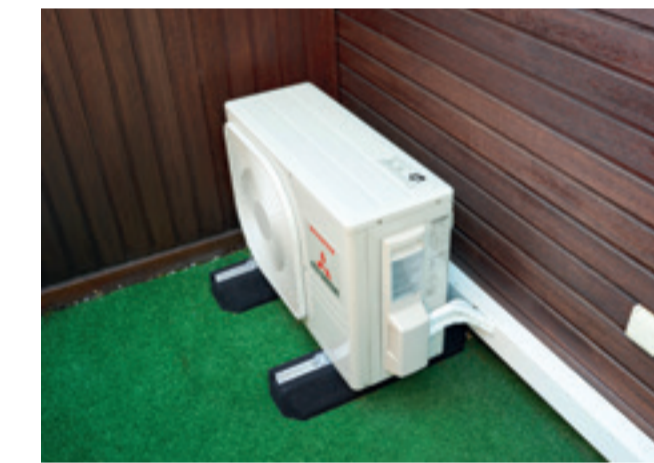
Außengerät – stabil montiert ...