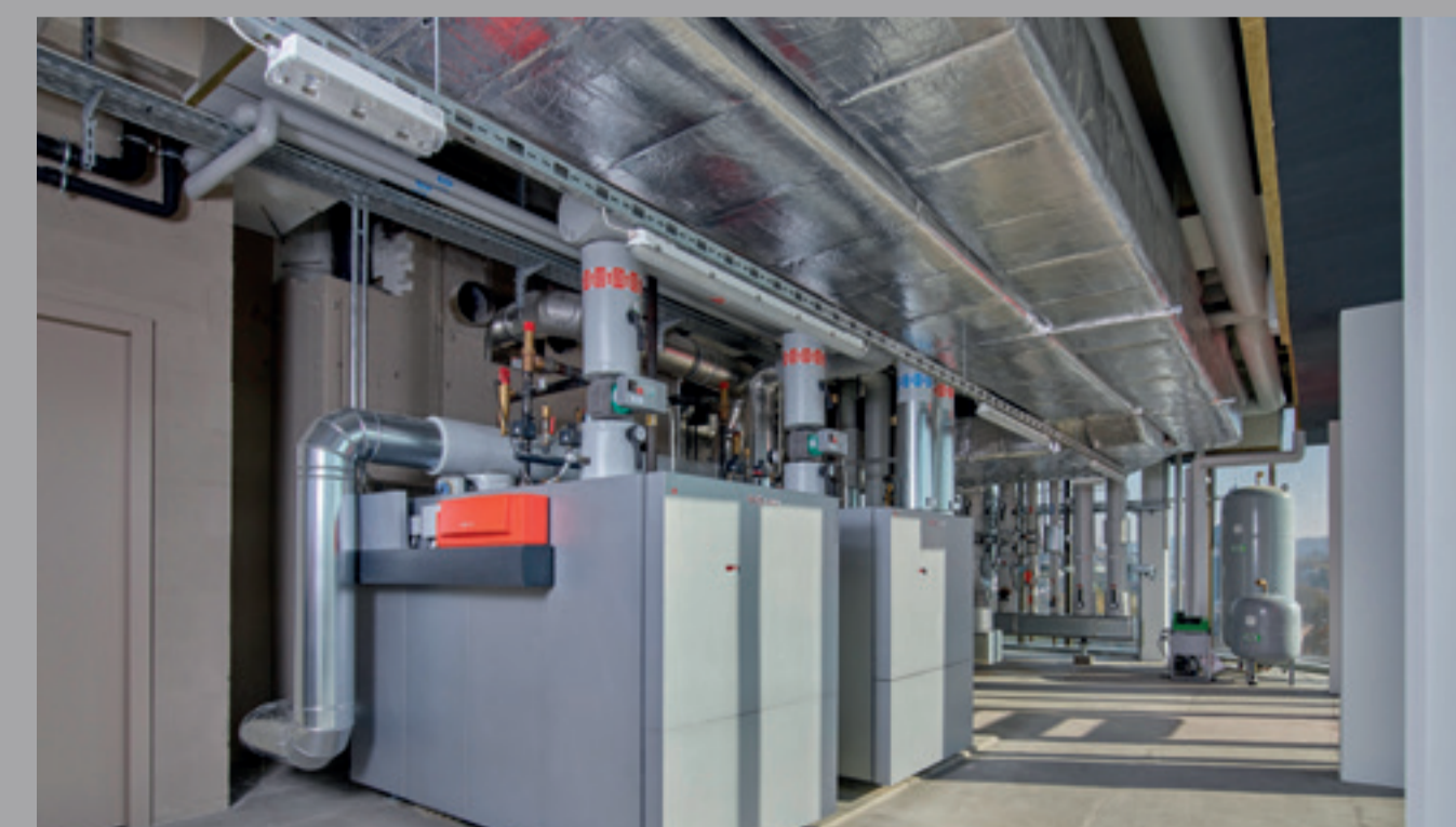
Zwei neue Gaskessel