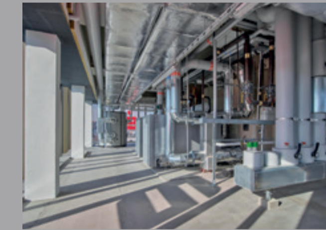
Technikzentrale mit Ausblick