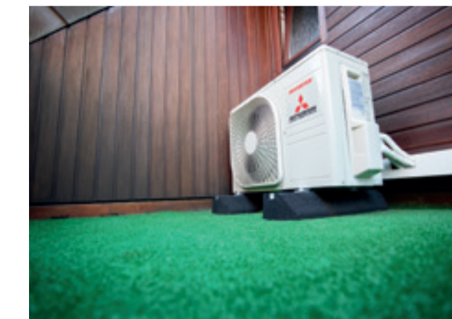
... auf „Big Feet“