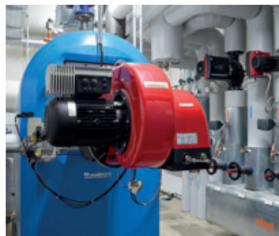
Kesselblock mit Brenner