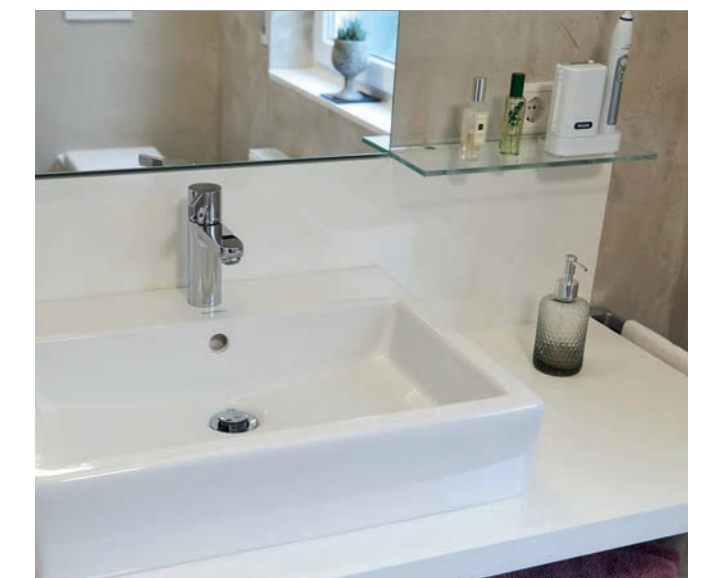
Modernisiertes Bad mit schönem Waschtisch