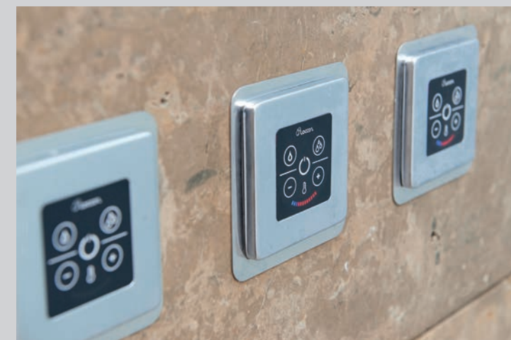
Steuerung für das perfekte Duschvergnügen