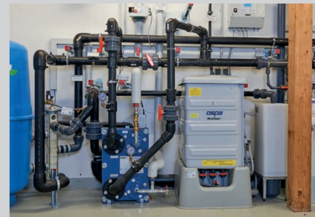
Schwimmbadtechnik übersichtlich und platzsparend