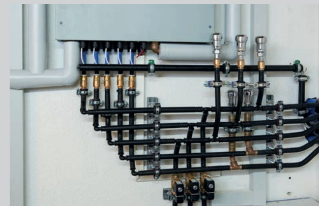
Die „Multibox“ sowie formschöne Armaturen (siehe Kasten links)