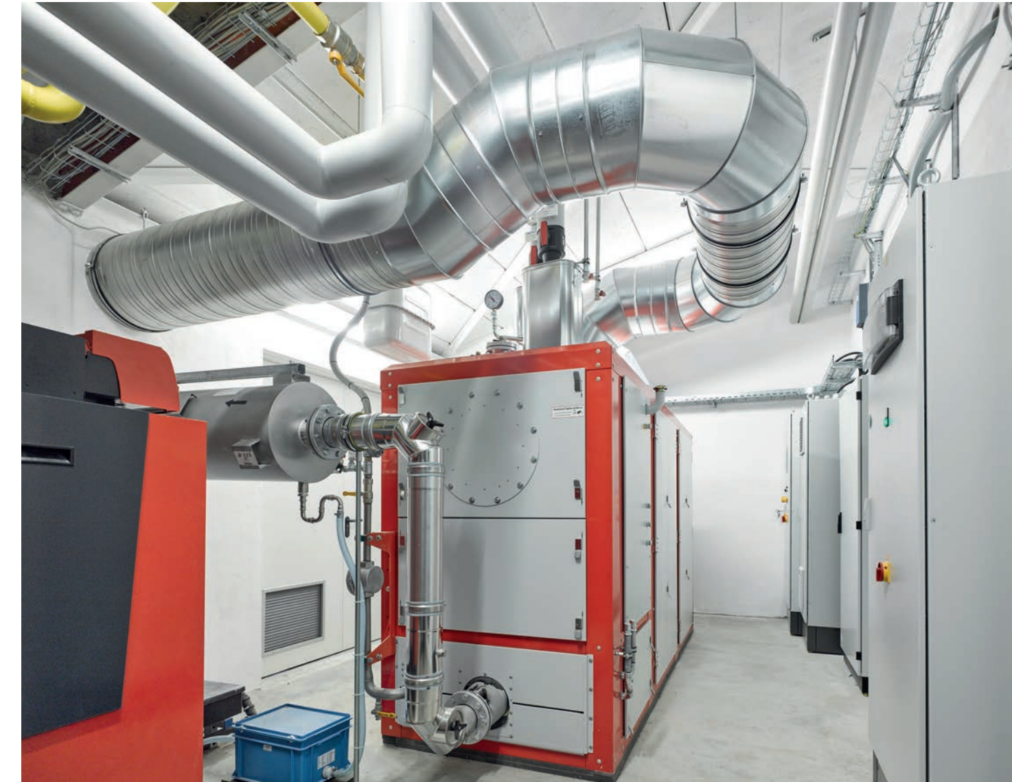
Das neue Blockheizkraftwerk in der aufgeräumten Technikzentrale