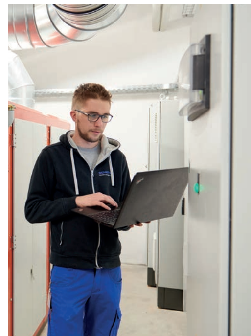
„Feintuning“ – die MSR-Technik wird optimiert