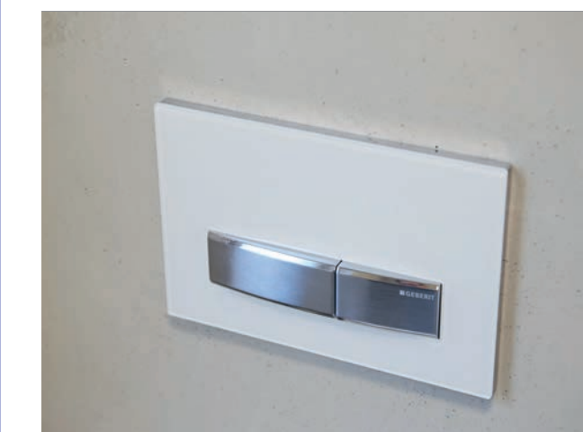
Taster für WC-Spülung