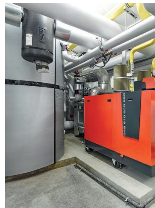
Spitzenlastkessel und Pufferspeicher